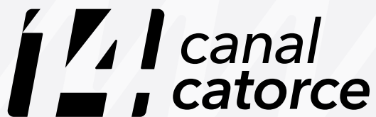
Logotipo en positivo sin transparencias.