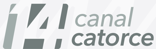
Logotipo en positivo, escala de grises.

Cuando por razones de uso o economía se requiera utilizar el color a una sola tinta, el logotipo se podrá utilizar en escala de grises en su forma positiva o negativa según el caso.