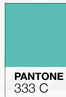
PANTONE 333 C