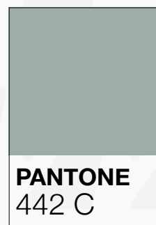
PANTONE 442 C

El sistema de color utilizado para la creación de identidad visual del Cana Catorce, se basa en la combinación de tres colores, gris medio, gris y turquesa.