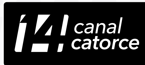
Logotipo en negativo sin transparencias.